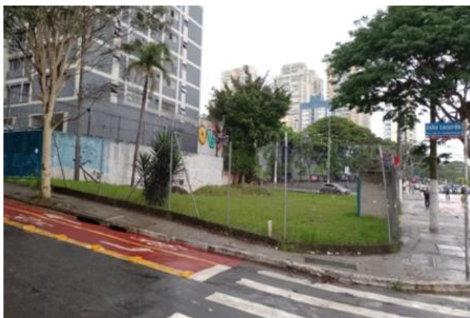
vista externa da área

Terreno localizado na R. João de Lacerda Soares, 181, esquina com Av. Roque Petroni Jr. e Av. Santo Amaro, no Bairro do Brooklin, São Paulo - SP. Está localizado em frente à Estação Brooklin da Linha 5-Lilás.