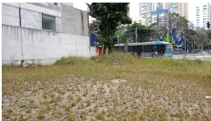
vista interna da área