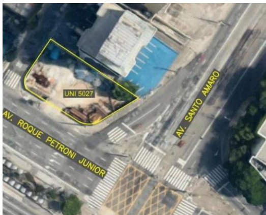
vista aérea da área