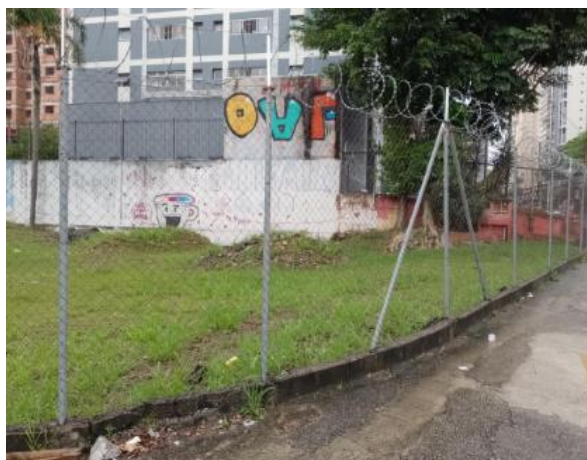
vista externa da área