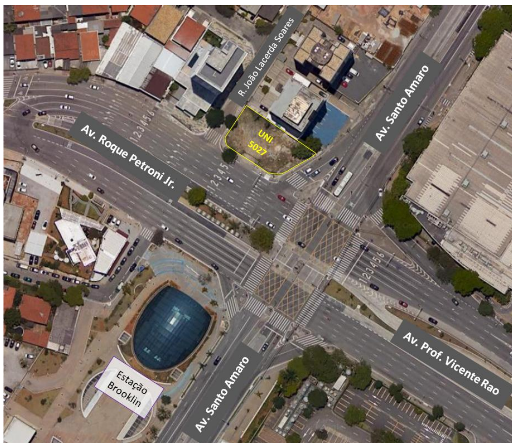
Croqui de localização